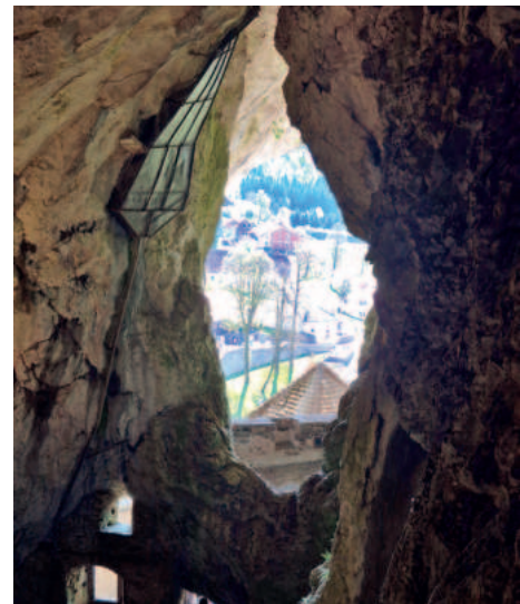
Blick durch ein natürliches Fenster