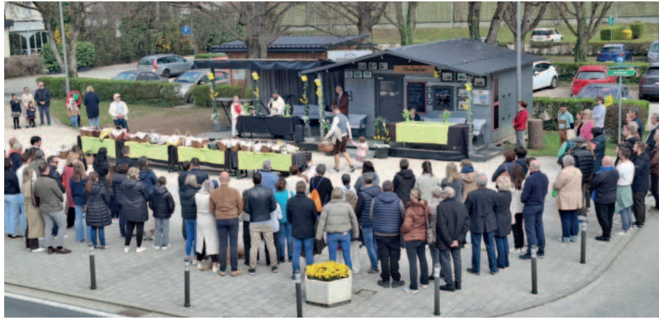
Fleischweihe am Marktplatz

und in geselliger Runde die Osterwünsche austauschen. Einen kleinen Eindruck des Geschehens möchten wir Ihnen hier zeigen.