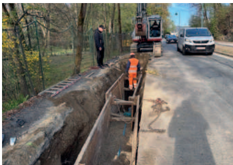
Künette für die Wasserleitung

Die Sanierung der Wasserleitung in der Hauptstraße zwischen Edelweißbad und Johannaweg ging zügig voran. Auch die Ampelregelung für den Begegnungsverkehr funktionierte tadellos. Die Bauarbeiten waren nicht einfach, einerseits behinderten die seitlichen Einfriedungen und andererseits die vielen Einbauten. Nun ist der Bereich schon wieder asphaltiert und befahrbar.