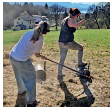
Osterschießen am Käte beim Brock