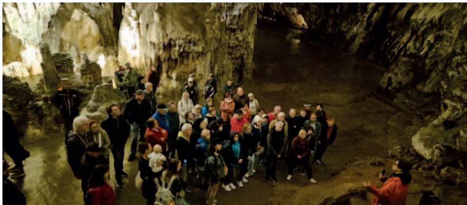
Besuch in den Karsthöhlen von Postojna