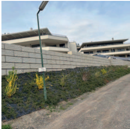
Entlang vom Riegelweg begrenzt eine Betonmauer das Grundstück

Das große Wohnbauvorhaben „The Lakes“ am Fronkogel an der Karawankenblickstraße ist fertiggestellt.