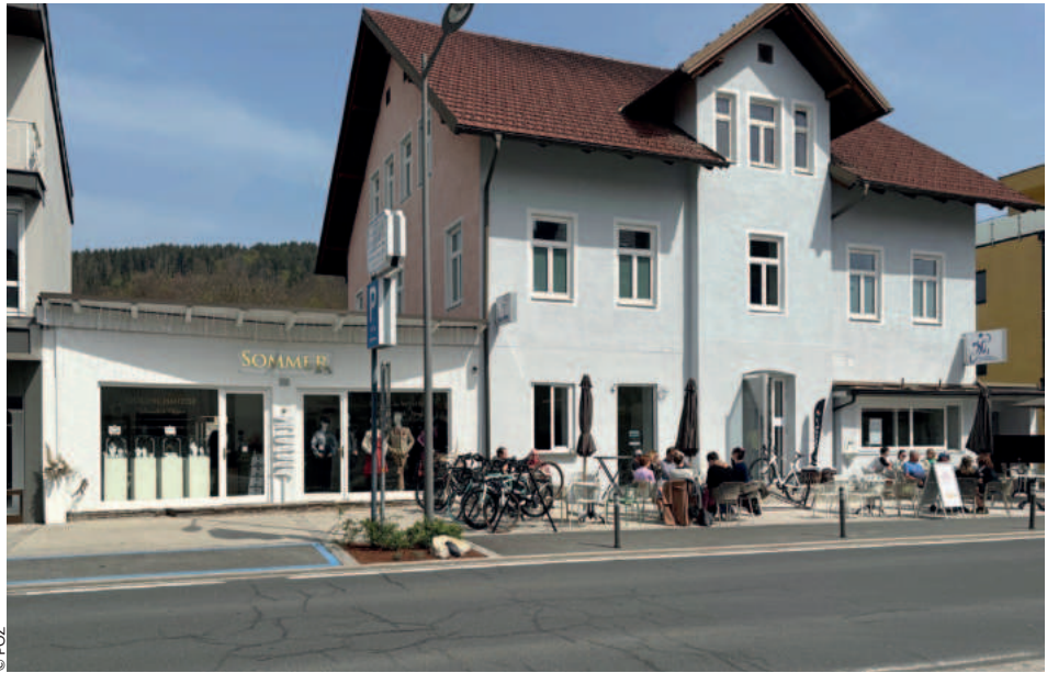
„SOMMER am See“ mit zwei exquisiten Verkaufsläden (li.) und Erdgeschoß des Hauses Hauptstraße 188 mit dem Bike Café ku:dos (re.)

Neben dem neuen Café gibt es in den Pavillons (Hauptstraße 190) zwei Geschäfte, die unter dem goldenen Slogan „SOMMER am See“ exquisite Mode und Goldschmiedearbeiten anbieten.