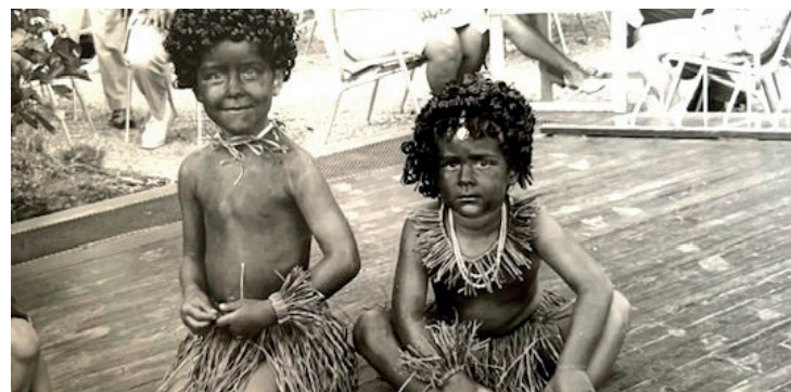
Veranstaltung für Kinder