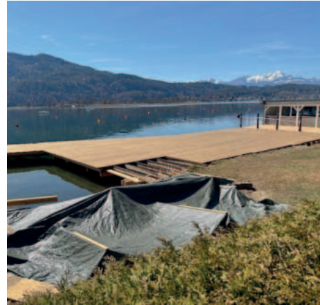
Der Steg des ehemaligen Strandhotel Prüller