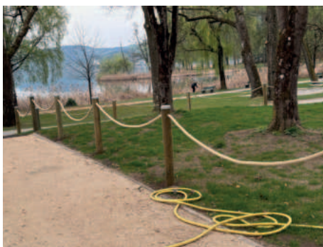
Abgrenzung und neue Makadamzufahrt vor dem „Besenschwingerheim“