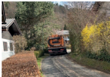
Straßenkehrmaschine im Einsatz

Außerdem wurde der Fisch vorm Gemeindeamt – zur Freude vieler Besucher:innen – neu bepflanzt. Vor dem „Besenschwingerheim“ am Landspitz wurde die Grünfläche renaturiert und mit Holzsäulen und einem Hanfseil abgegrenzt. Auch eine kleine Asphaltfläche ist entfernt worden, dadurch wurde wieder eine Grünfläche am Landspitz dazugewonnen. Beim Edelweißbad ist der Sichtschutz angebracht worden.