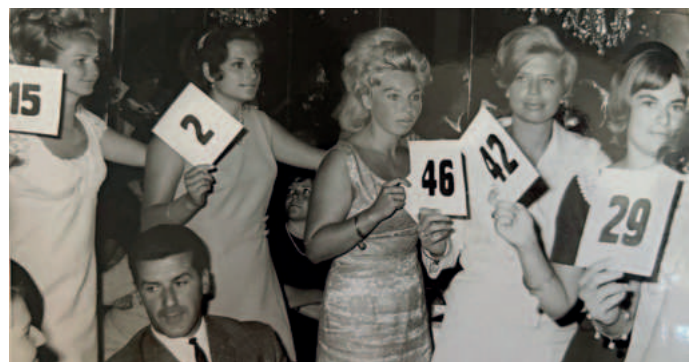
Wahl der „Miss Pörtschach“ – ein begehrter Titel