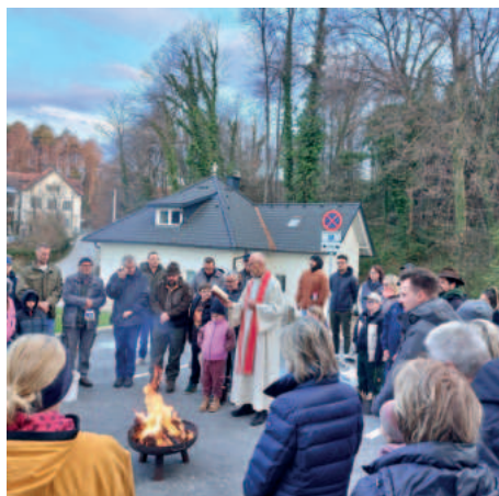
Das geweihte Feuer wurde geholt