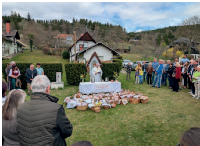
Fleischweihe beim Marterl in Pritschitz