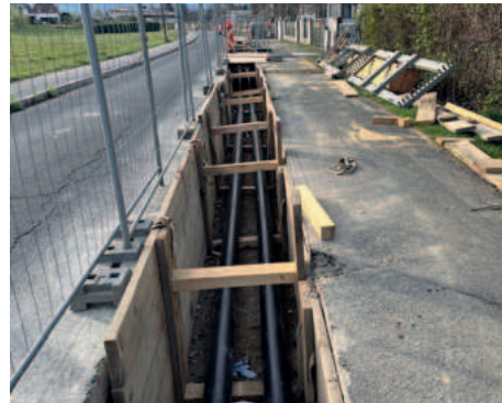
Die gepöhlte Grabungskünette

In der Seeuferstraße wurde ab dem Kreisverkehr bei Hofer in Richtung Osten die Fernheizung verlängert, das ist sicher ein großer Gewinn für die Anrainer und die zukünftigen Wohnanlagen.