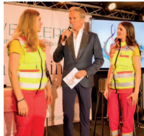
Der Tombolagewinn wurde der ÖWR zum Ankauf eines Defibrillators übergeben