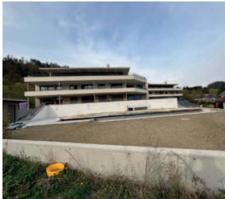
Blick von Westen auf die beiden Baukörper