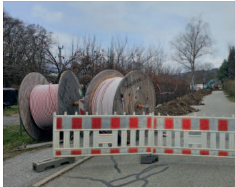
Sperre der 10.-Oktober-Straße

Der weitere Glasfaserausbau erfolgt massiv in der 10.-Oktober-Straße, der Winkelnerstraße, im Kornblumenweg, Auf der Werzer Leitn und im Scherzweg. Der Verkehr wird hier großflächig umgeleitet. Positiv fällt auf, dass die Instandsetzungen neben der Straße sorgfältig erfolgen.