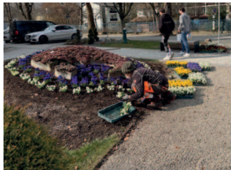
Der Blumenfisch wird durch die fleißige Gemeindegärtnerin bepflanzt