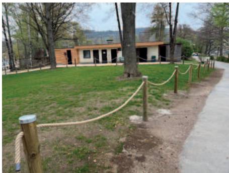
Die neue Grünfläche mit attraktiver Abgrenzung