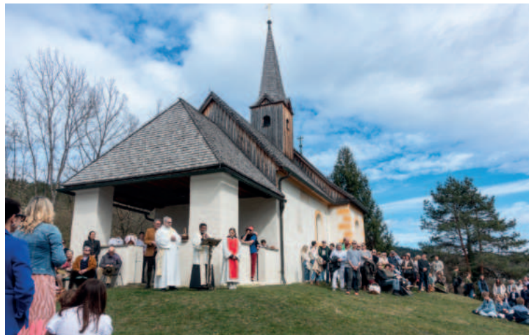
Fleischweihe beim Goritschacher Kircherl