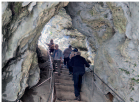
Stiege im Innenbereich der Höhlenburg