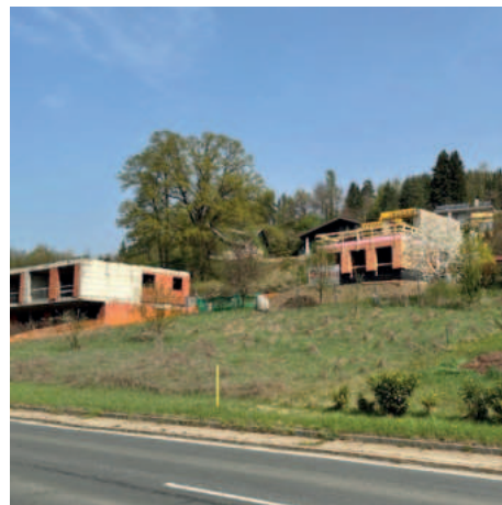
Neubau in Pritschitz neben dem verlassenem Rohbau

Erfreulicherweise werde einige Häuser auch umgebaut und somit der Altbestand erhalten.