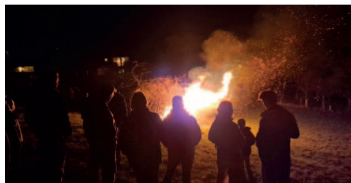
Osterfeuer in Pritschitz