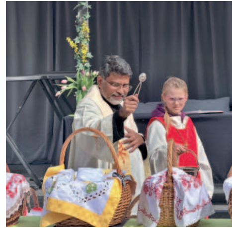
Die Speisen wurden gesegnet