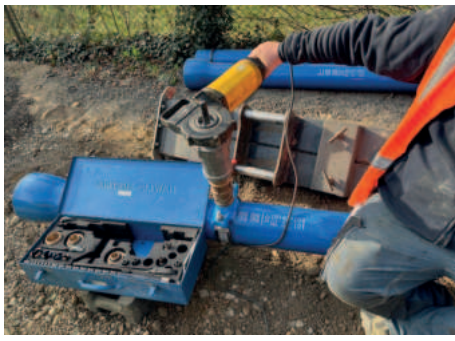
Anbohren eines Hauswasseranschlusses für die Versorgungsleitung