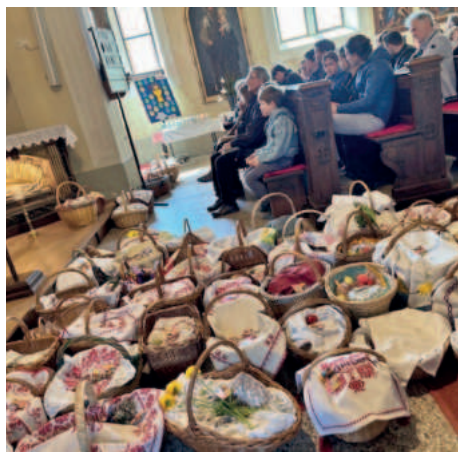
Osterkörbe in der katholischen Kirche