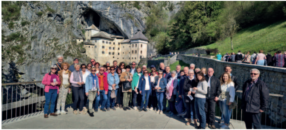
Die Lesergemeinschaft vor der Höhlenburg Predjama