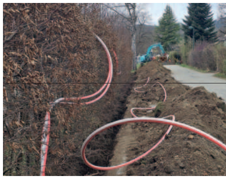
Auslegen der Verrohrungen für die Glasfaserverleitungen