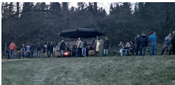
Osterschießen auf der Ille Leitn