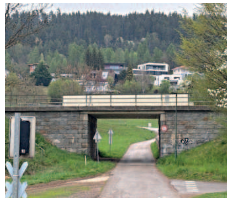
Brücke über den Goritschacher Weg

Die Bundesstraßenbrücke über den Goritschacher Weg wird nun saniert. Die Fahrbahndecke und die Randleisten wurden abgetragen und werden neu aufgebaut.