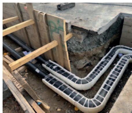
Richtungsänderung der Rohrleitungen