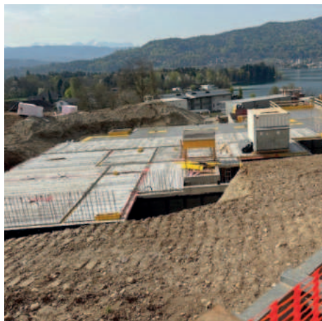
Ansicht der Baustelle von Norden, mit Blick auf die Pritschitzer Bucht und Maria Wörth

In Pritschitz errichtet die Fa. Kollitsch neben der Wohnanlage „Bestseller“ nun die exklusive Wohnanlage „High Smile“ mit 12 Wohnungen. Das Tiefgaragenschoß ist bereits fertig. Bestehend an dem Bauvorhaben ist die großartige Sicht auf die Pritschitzer Bucht und den Wörthersee.